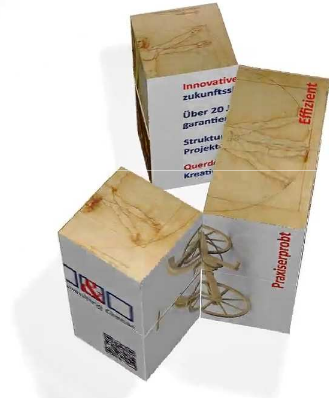
B&L Management Consulting GmbH