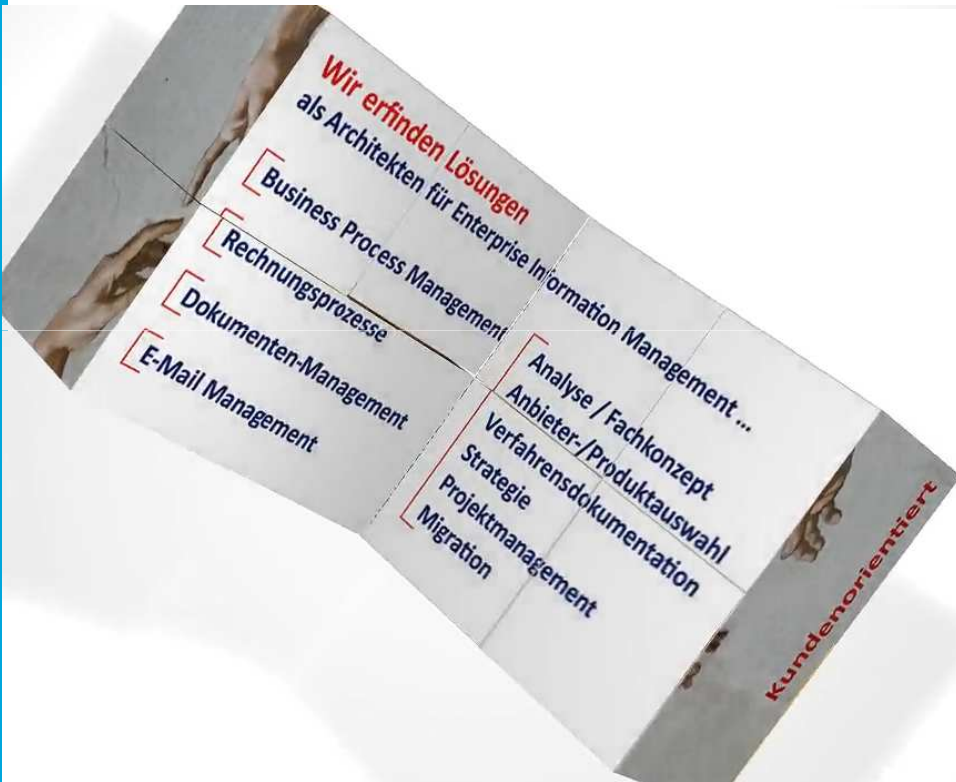
Elektronische Bauakte bei Energieversorgern